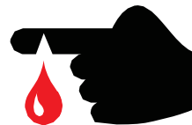
Heridas infectadas expuestas/forúnculos en manos o brazos