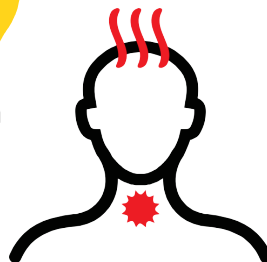
Dolor de garganta con fiebre