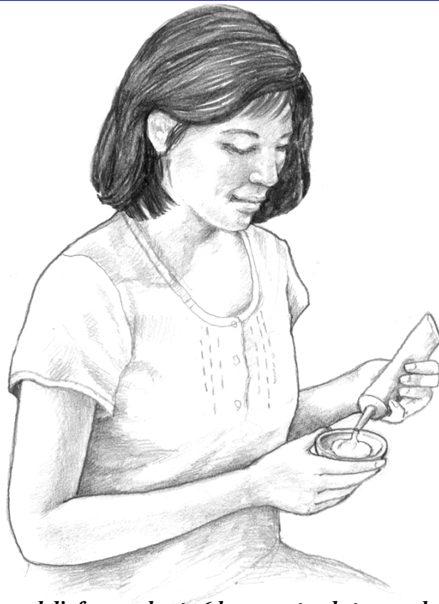
Se puede poner el diafragma hasta 6 horas antes de tener relaciones sexuales.

Primero debe ir al médico para que le tomen la medida. La crema o jalea anticonceptiva que se usa con el diafragma se puede comprar en farmacias y supermercados.