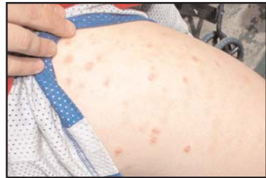
Reacción alérgica a causa de un chinche.

Estos insectos inyectan una pequeña cantidad de saliva en la piel mientras se están alimentando, lo cual puede provocar una reacción alérgica alrededor del área donde penetra la piel que causa inflamación y comezón. No se rasque la picadura, ya que le